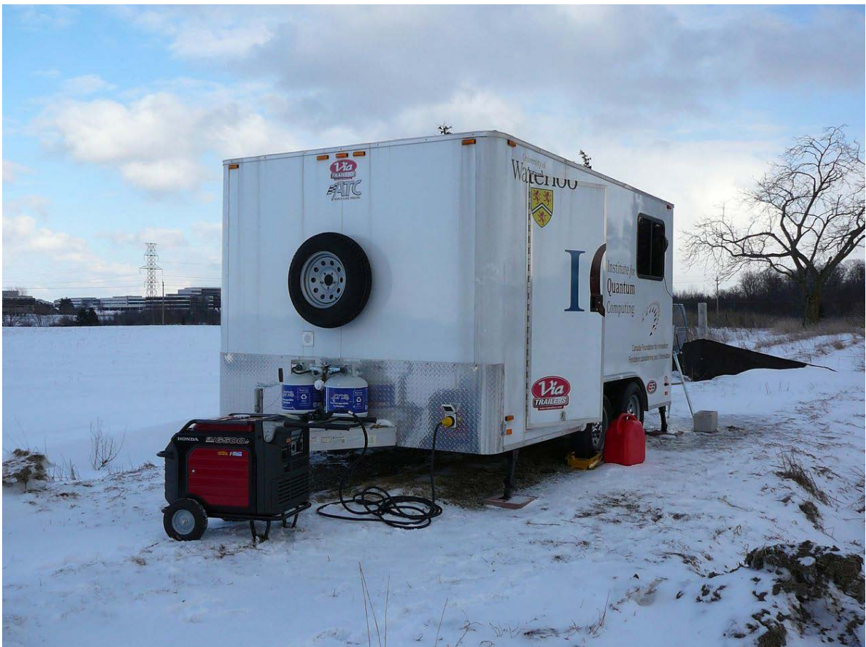
In solchen Trailern sind die aufwändigen Messstationen untergebracht.