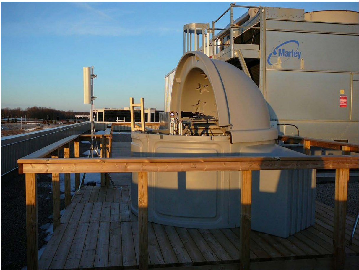
Eine Senderstation, die die verschränkten Photonen in die hunderte Meter entfernte Messstation schickt.