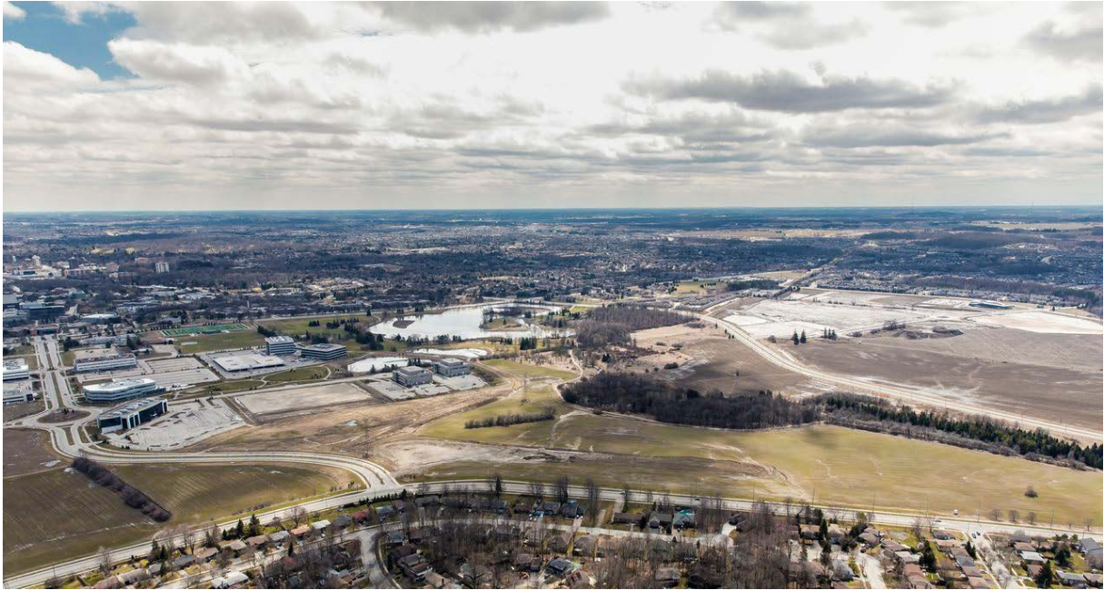
Das Gelände der University of Waterloo in Kanada, auf dem das Experiment durchgeführt wurde.